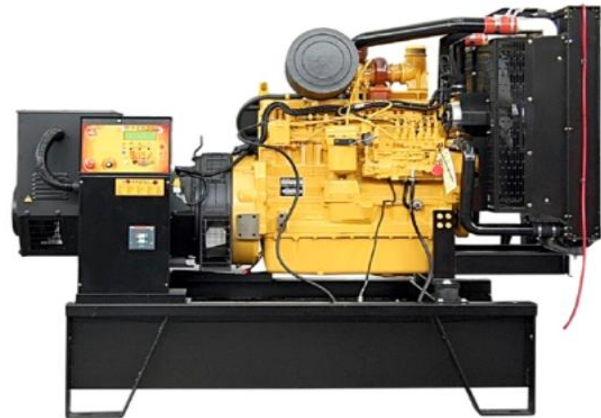
Mod. JD 250 B

Die bekannte Stromerzeuger-Modellreihe POWERFULL ist in der Version B mit einer großen Auswahl von Motoren und Leistungen von 9 bis 800 kVA bei 50 oder 60 Hz erhältlich. Die Hauptmerkmale der Modellreihe B sind ein Rahmen vom Typ T, der mit dem Ziel entworfen wurde, maximale Kompaktheit zu bieten und den Platzbedarf des Aggregats auf das geringstmögliche Minimum zu beschränken, denn dies ist häufig eine Notwendigkeit bei Installationen in sehr kleinen Räumen; gleichzeitig dient der Rahmen auch als Kraftstofftank und bietet ein großes Fassungsvermögen direkt in der Maschine. Wie jedes Produkt wird die Maschine vor der Auslieferung einem strengen Funktionstest unterzogen, bei dem alle Bauteile in über 30 Kontrollen geprüft werden.